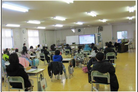
2月14日（月）ホットネットセミナー 便利な情報機器と上手に付き合うために大切なことを学びました。