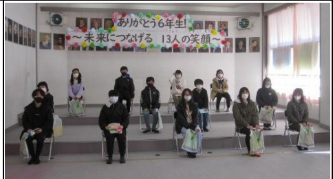
2月25日（金）6年生を送る会 当日 あられる笑顔で、感謝の気持ちを伝えました。