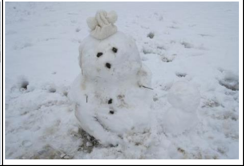
2月10日（木）今シーズン初の積雪 雪を楽しみました。