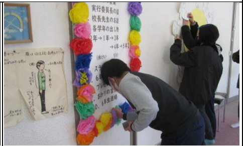
2月24日（木）6年生を送る会 前日準備 5年生が力を合わせて準備を進めました。