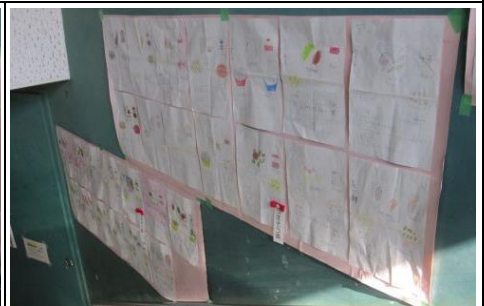
夢の給食コンテスト（給食委員会） 子どもたちから素敵なメニューがたくさん寄せられました。