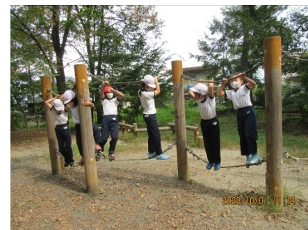
1, 2年生遠足 笛吹市一宮町 山梨県森林公園金川の森