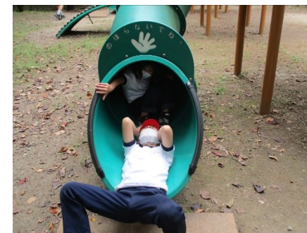
1, 2年生遠足 笛吹市一宮町 山梨県森林公園金川の森