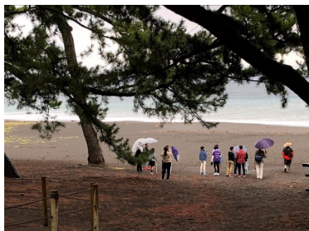
6年生修学旅行 静岡市清水区 三保の松原