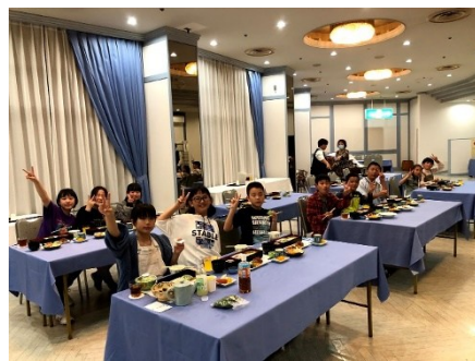
6年生修学旅行 焼津市田尻北 ホテルテトラリゾート静岡やいづ