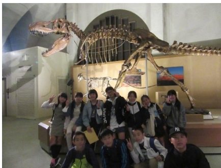
6年生修学旅行 静岡市清水区 東海大学自然史博物館