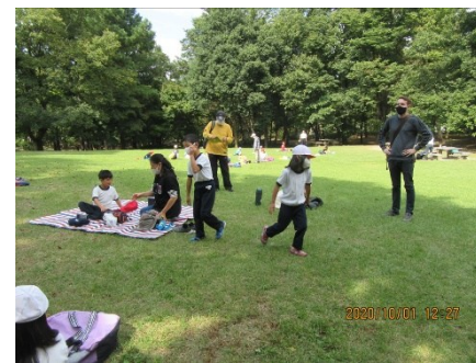
1, 2年生遠足 笛吹市一宮町 山梨県森林公園金川の森