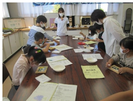
3, 4年生遠足 笛吹市石和町 帝京大学やまなし伝統工芸館