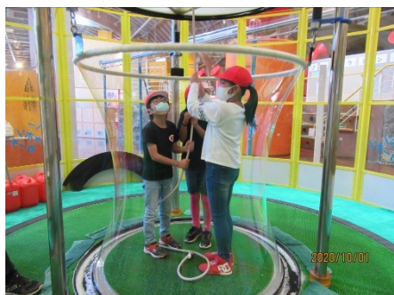
3, 4年生遠足 甲府市愛宕町 山梨県立科学館