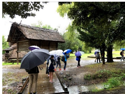
6年生修学旅行 静岡市駿河区 登呂遺跡