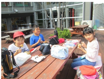
3, 4年生遠足 甲府市愛宕町 山梨県立科学館