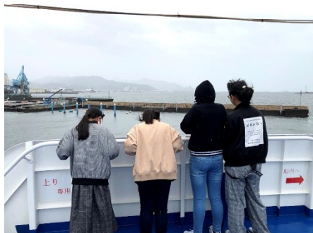
6年生修学旅行 静岡市清水湾 クルーズ船甲板