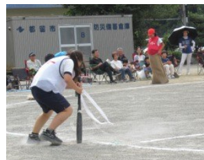
No Limit~Fuzoku スパルタン