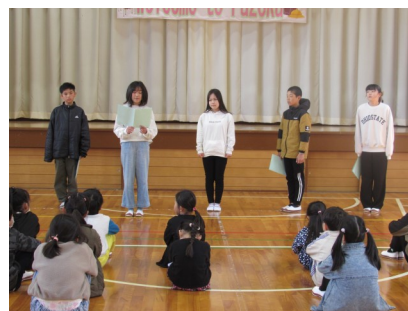
4月8日(火) 始業式 6年「新学期への希望と抱負」