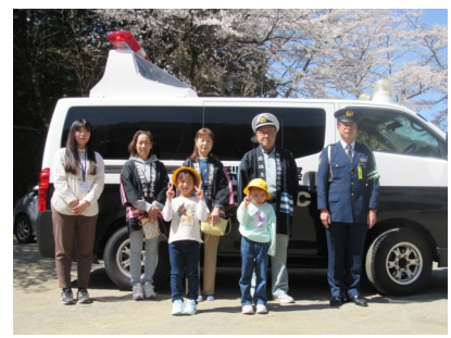
4月9日(水) 1年生 交通安全教室