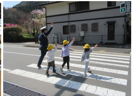
4月15日(月) 1年交通安全教室