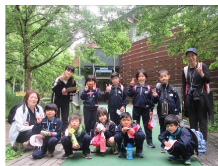
1・2学年 水族館入り口にて(忍野村) 1年生も思い出ができたかな？