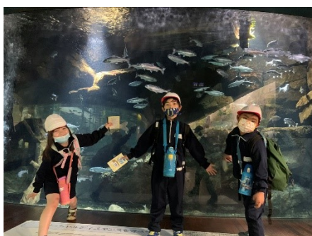
1・2学年 山梨県立富士湧水の里水族館(忍野村) 大きな魚でうれしい、びっくり

昨年度実施できなかった春の校外学習が全学年実施できました。子どもたちはとても楽しそうでした。「コロナの影響か、子どもたちは疲れやすかった」と複数の先生方の弁です。