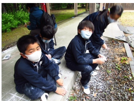
4・5学年 林間学校(ゆずりはら自然の里) 真っ白になったまがたま磨き