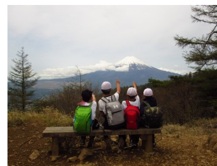
6学年 三つ峠山頂下広場(富士河口湖町) 富士が絶景だ。天気もサイコー！