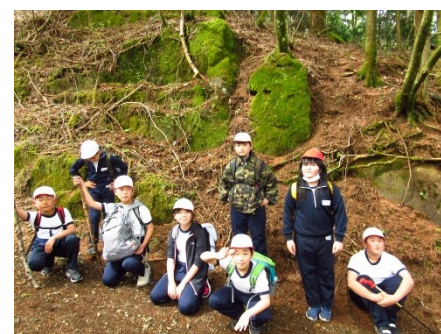
6学年 三つ峠登山道(富士河口湖町) 上りはじめは、余裕だったが…