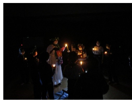
4・5学年 林間学校(ゆずりはら自然の里) 厳かなキャンドルサービスの夜