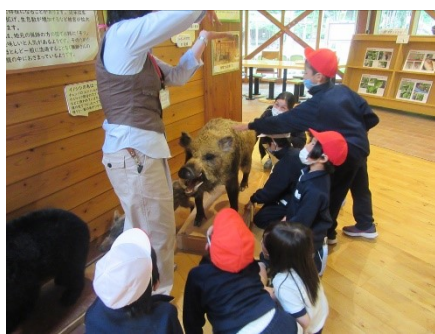
1・2学年 森の学習館(忍野村) ツキノワグマの食料は植物9割！！