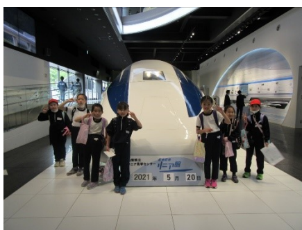
3学年 リア見学センター(小形山) 新型リニアは速くて、轟音。