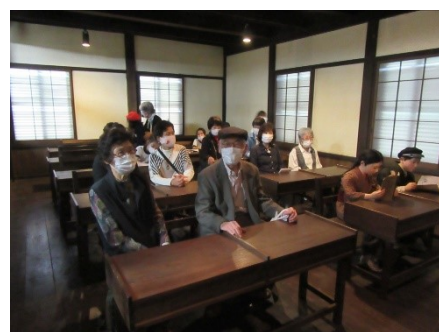
3学年 尾県郷土資料館(小形山) 昔の教室でお年寄りのみなさんと。