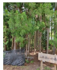
ふれあいの森と椎茸日よけ