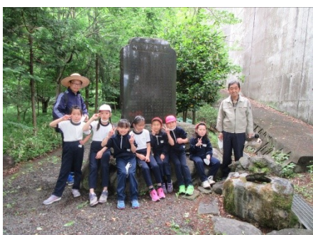
3学年 二か堰の記念碑前(小形山) 郷土資料館館長さんが案内