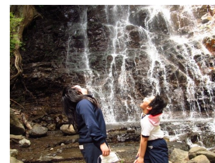
6学年 母の白滝(富士河口湖町) 白滝の水はおいしー???

修学旅行は秋に延期になったけど、附属っ子はコロナに負けずに行事もがんばっています。