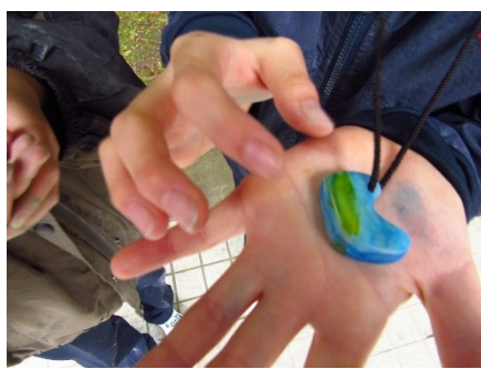
4・5学年 林間学校(ゆずりはら自然の里) できあがった色つきのまがたま