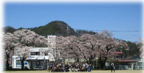
【山梨県警さちかぜ号による交通安全教室（1年生）】