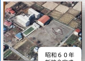
昭和60年 新校舎完成