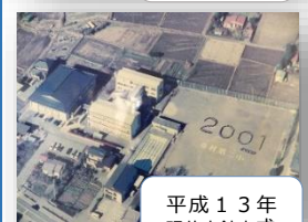
平成13年 現体育館完成