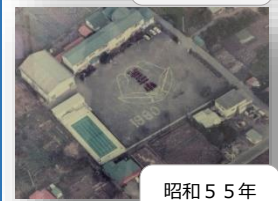
昭和55年 プール完成