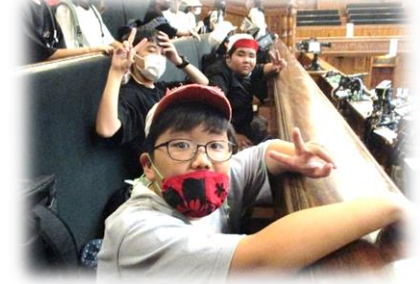
国会議事堂本会議室