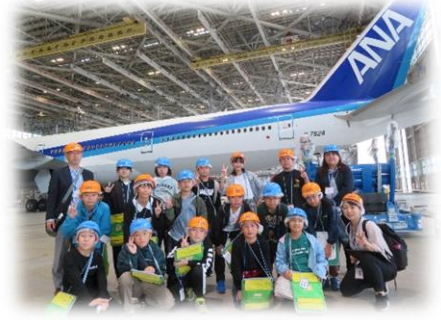
全日空機体整備工場