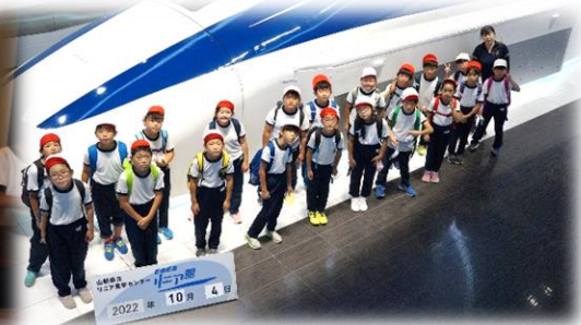
リニア見学センター