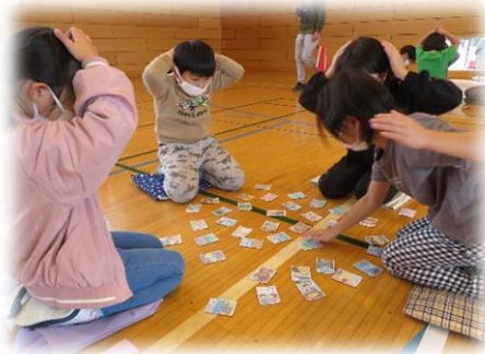
ふるさと山梨かるた大会（予選）

秋もしだいに深まり、山々の木々が美しく色づき始めました。今週の火曜日には三ツ峠も雪化粧をして、その早さに驚くとともに、冬の訪れを感じている今日この頃です。