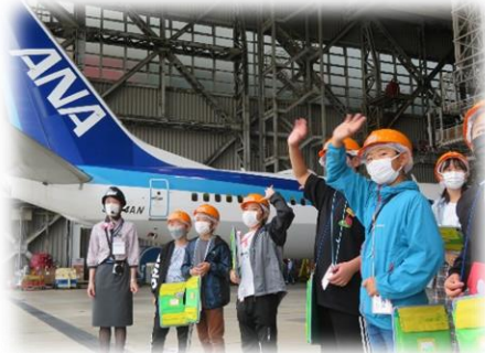
全日空機体整備工場