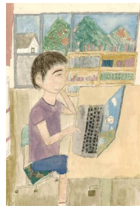
3年 ひかりさん パソコンをいじると なりの子