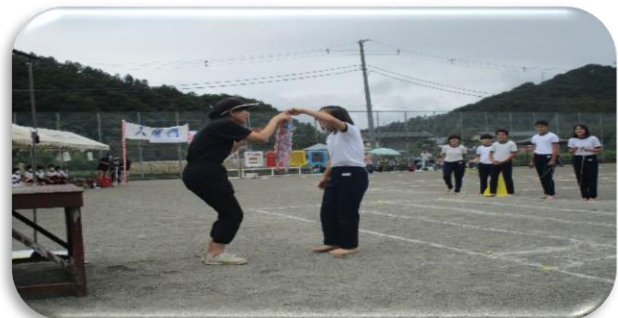
高学年のプライドを見せてくれた5・6年生の「Rewrite the stars 力を合わせて最高のパフォーマンスを」