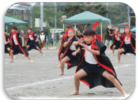
勇姿みなぎる気合いの入った3・4年生の表現「YANISHO2021! ソーラン節」