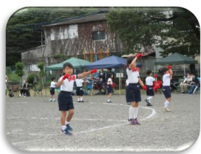
息ぴったりの愛らしく、微笑ましかった1・2年生の表現「すてきな日曜日」