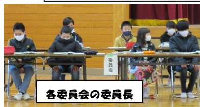
各委員会の委員長