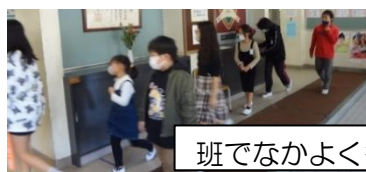
班でなかよく行動