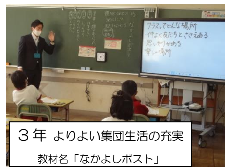
3年 よりよい集団生活の充実