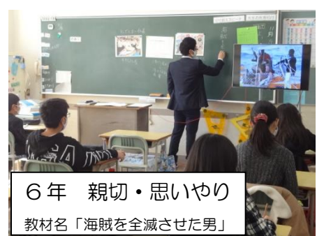
6年 親切・思いやり