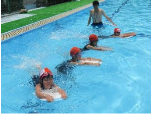
1年生は、初めてのプールです。

【水泳指導】 6月10日のプール開き以来、なかなかプールには入れませんでした。下旬にはプール日和の日もあり、水泳指導が始まりました。子どもたちはプールが大好きです。朝から「今日はいれる?」「水温何度かな?」とそわそわしています。学校のプールでの指導は、のびのびとじっくり取り組めるのでありがたいです。今年も昨年同様、スイミングスクールの指導者を招き、より丁寧な個に応じた指導をめざします。