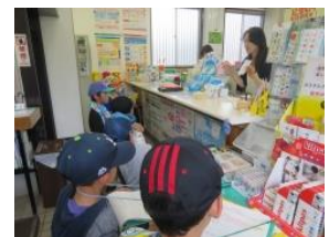
郵便局ではいろいろな切手を見ました

2年生 生活科~町探検では、6月18日に「駐在所」と「コミュニティーセンター」、19日に「本光寺」と「郵便局」に見学に行きました。話を聞くときの態度、質問の仕方、メモの取り方、場に応じた行動など、たくさんのお話を学ぶことができました。