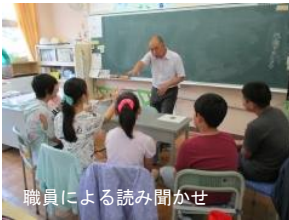
職員による読み聞かせ

職員による読み聞かせは、「今、出会わせたい」本を読み聞かせたり、興味関心が広がるような本を紹介したりと、選書や朗読には職員の個性が発揮され、思いが込められています。