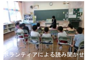
ボランティアによる読み聞かせ

また、1、2年生には地域の方にボランティアで読み聞かせをしていただいています。子どもたちの興味関心や発達段階にあわせて本を選んでいただき、読書意欲を引き出してくれています。