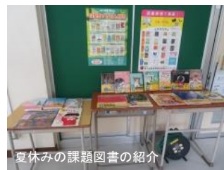
夏休みの課題図書を紹介