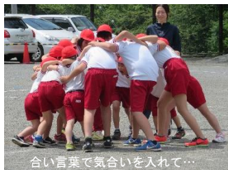
合い言葉で気合いを入れて…

6月14日、梅雨の晴れ間に恵まれ、多くの保護者のみなさんと地域の方々の声援をいただきながら、実施することができました。全校を4つのグループに分け、2チームごと紅白に分かれての対抗戦で行いました。3種目、どれも接戦で盛り上がりました。