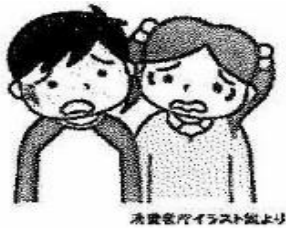
児童教育イラスト集より