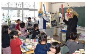
「悪い子はいねーかー」

心のあいをおさげよう 二月二日(金)は、「節分給食」でした。今年も一、六年生の各教室に赤鬼と青鬼が現れました。一年生の教室の廊下には、「心のおにをおい出そう」という、かわいい掲示物があります。「ふぎけお」「なまむしおに」「うじわるおに」「いじめおに」など、一人ひとりのおにを退治しています。