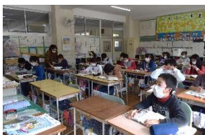
空席が目立つ教室

インフルエンザにご注意を 宝小では、二月九日(金)から欠席者数が急激に増え、連休明けの十三日には、インフルエンザによる出席停止を含めて十三人が欠席となりました。連休をはさみ家で十分休養してもらえたので、何とか収束したように思います。学年末の大事な時期。元気に活動してほしいです。