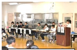
各委員会の委員長