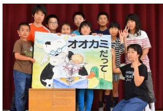
がんばった図書委員さん