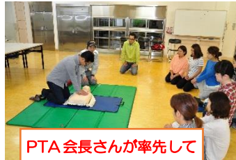
PTA会長さんが率先して

心肺蘇生法講習会 六月十五日 PTA保健環境委員会では、都留市消防署救急救命士の相川さんをはじめ四名の署員の方を講師にお招きして、AEDの使い方や心臓マッサージの仕方など丁寧に教えていただきました。参加者は、夏休みのプールの監視補助をしていただくPTA本会の役員さんと保健環境委員会のみなさんでした。実際にあつてはいけないことですが、いざというときに命を救う冷静で勇気ある行動がとれるよう真剣に学習しました。プールだけでなく、家でも対応できる内容でもよい講習会になりました。