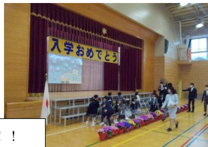
何でもできる「スーパー一年生」になろう!!!