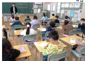
学力アップを期待しています

一月二十八日の三・四校時に学力検査CRTを行いました。国語と算数の学力がどの程度身に付いているかを調査し、課題を把握してこれからの学習にいかしていきます。