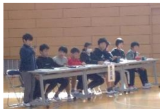
各委員会の委員長