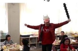
「宿題忘れた子はいないかー」

一月三日(月)は、「節分給食」でした。今年も一〜六年の各教室に赤鬼白鬼が現れました。谷一小的の子どもたちには、心の中にどんなオニがいるのでしょうか。「けんかオニ」「なきむしオニ」「いじわるオニ」「いじめオニ」「なまけオニ」など、一人ひとりのオニを退治して、ますます良い子になってほしいです。