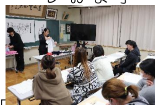
ご入学を心待ちにしています

一月二十七日に会議室において入学児童保護者説明会を行いました。来年度は、三十八名を予定しています。 準備していただく物や通学路の確認、入学前のできるよううにしてほしいことなどをお伝えしました。小一プロブレ△解消や安心できる入学を、期待しています。