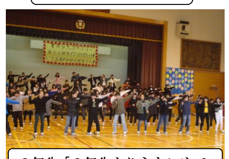
6年生「6年生より心をこめて」