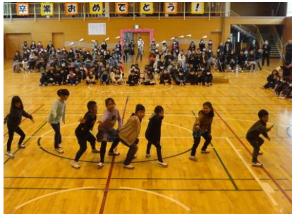
2年生「ありがとう！大好きだよ」