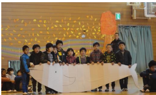
1年生「音楽劇『くじらぐも』」