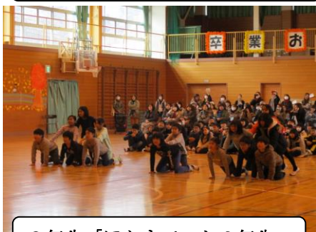
3年生「ほんまでっか6年生」