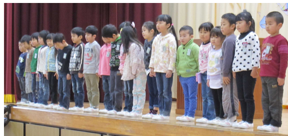
1年生21名がステージに整列