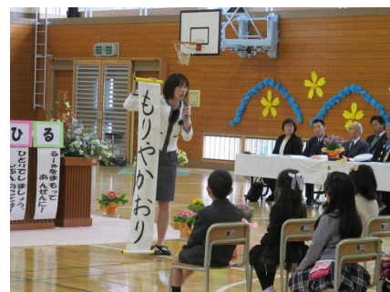
担任の話当真に聞く1年生