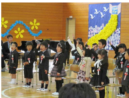
元気に答える1年生

今年度の宝小学校は18名の教職員（含：給食調理員）で指導にあたります。保護者の皆様と学校がしっかりと手を結び、地域の皆様方のご協力も得ながら教育活動を進めてまいります。保護者の皆様方のご理解とご協力、ご支援をお願いいたします。また、学校をもっと身近な場所と考えていただき、お気軽にお立ち寄りいただき、何なりとご相談いただければ幸いです。