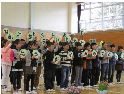
みんなで頑張ろう 6年生